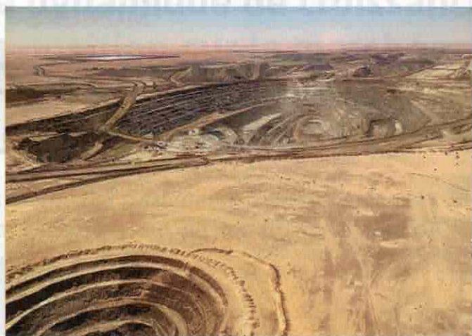
La mine de Tasiast est exploitée par Kinross depuis 2010.

Maaden Mauritanie est le shérif chargé de civiliser ce far west sur les sables, là où, jusqu'à présent, seuls pâturaient les dromadaires. ●